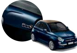
475 500 Mavisi