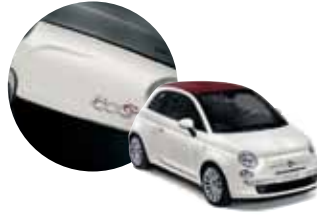
268 500 Beyazı