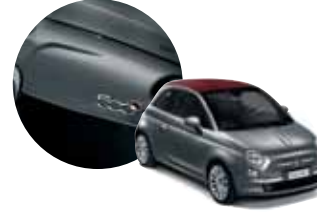
695 500 Koyu Gri