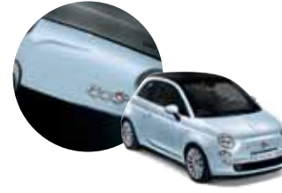
294 500 Buz Mavisi