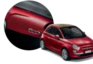
I64 500 İnci Kırmızısı