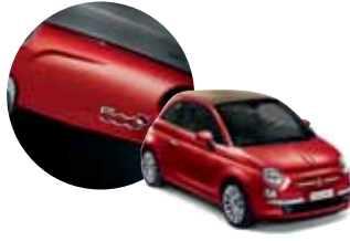
III 500 Kırmızısı