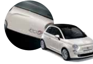
270 500 İnci Beyazı