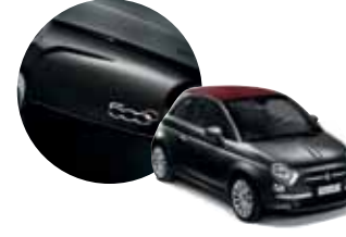
876 500 Siyahı