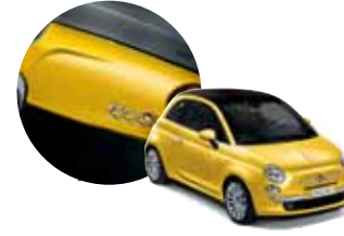
509 500 Sarısı